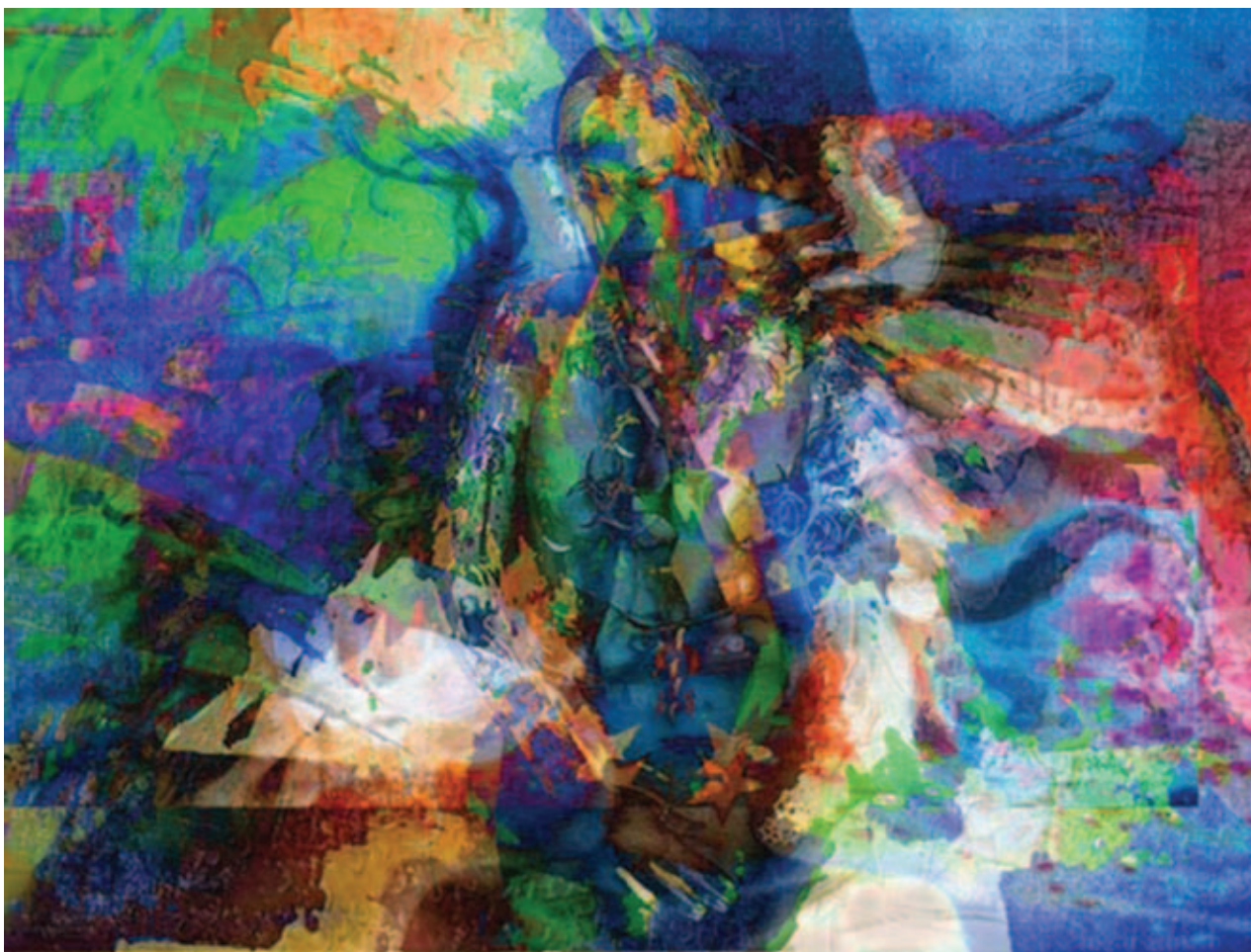
Урмин И.Е. Холст. Без названия