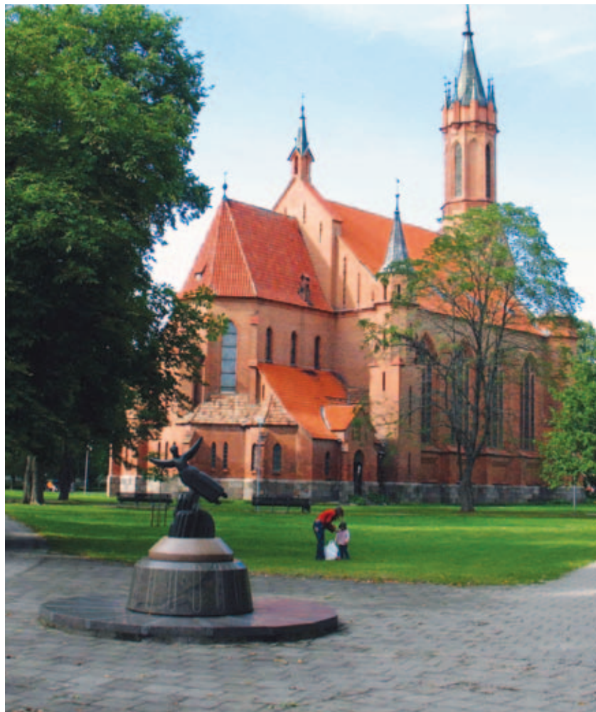
Центр «Саулуте» для пациентов с детским церебральным параличом, их лечение и реабилитация проводится на знаменитом курорте Друскининкай

Команда специалистов проводит программу обучения родителей с целью закрепления достигнутых результатов и адаптации ребёнка.