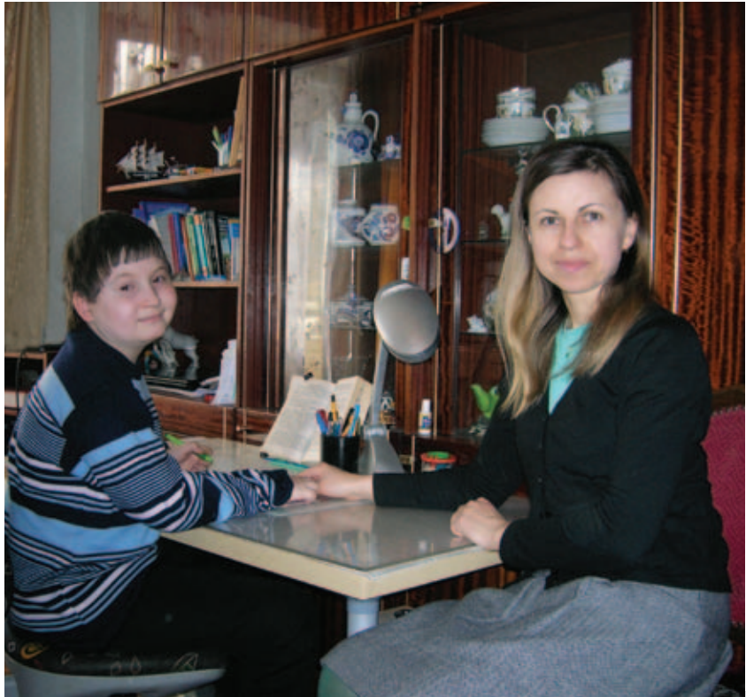
Автор статьи: Ирина Валерьевна Кружилова, психолог ОРНсОФиУВ ГБУ ЦСО «Лефортово», с подопечным

Трагедия в семье случилась внезапно. У мальчика было внутримозговое кровоизлияние, вследствие чего произошёл паралич правой ноги и руки.