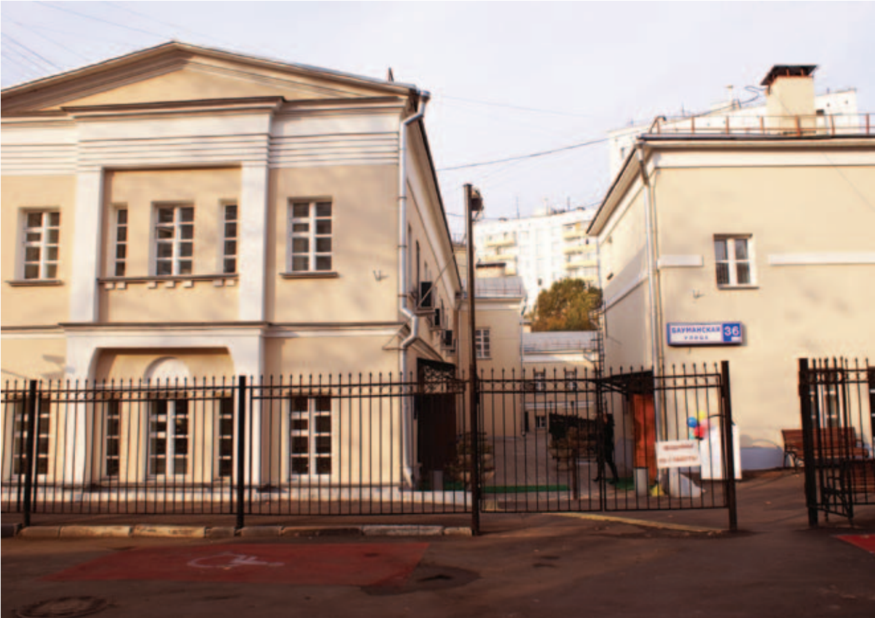
ГБУ Центр социального обслуживания «Басманный»