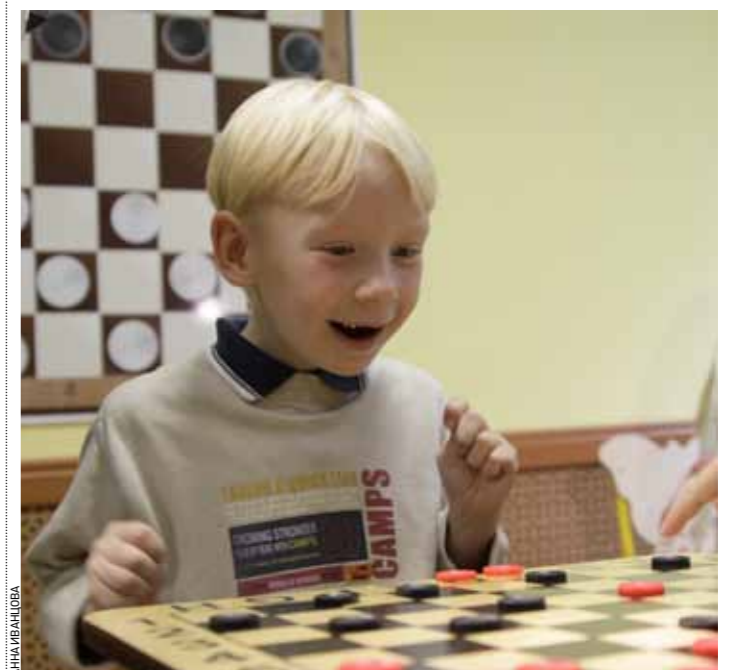
Сейчас как выйдут в дамки!

А еще хочу сказать, что наша организация имеет свою историю и традиции, и многие из тех, кто когда-то в конце 90-х приходил к нам вместе с мамой — выросли, завели свои семьи — и своих детей, но связей с нами не порывают. Наша программа и цель очень простые: мы хотим, чтобы все дети и их родители были счастливы. А наш девиз — давайте помогать людям и любить друг друга!