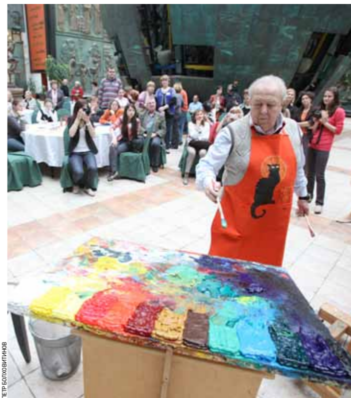
Богатырская палитра мастера

и молодых людей с проблемами здоровья, занимающихся живописью была организована совместными усилиями Регионального благотворительного общественного фонда по поддержке социально незащищенных категорий граждан, Московского музея современного искусства и Департамента социальной защиты населения города Москвы. Работники галереи Зураба Церетели прекрасно подготовили проведение мастер-класса, организовали для ребят экскурсию по