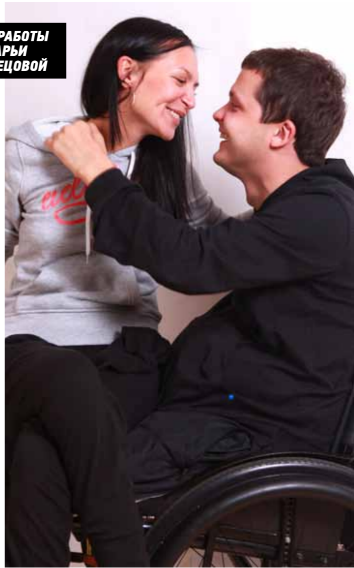
«Тебе хорошо со мной?»

боль, преодолевших отчаяние. Прорыв, спасение, свет надежды, реальная возможность жить!