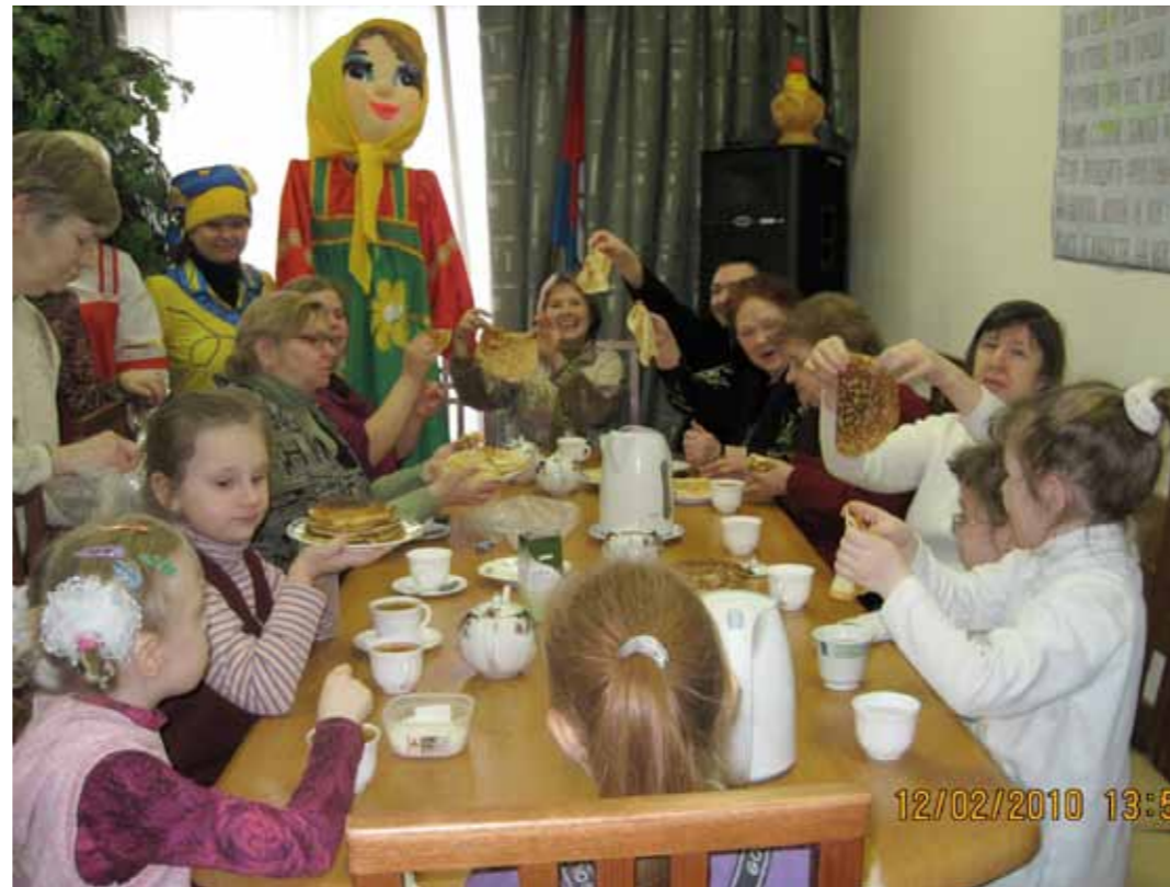
Чаепития у нас всегда проходят весело

ствие в трудоустройстве. По медицинским показаниям можно посещать занятия АФК, тренажерный зал, сеансы на массажном кресле и сеансы релаксации (психологической разгрузки). У нас вы сможете подобрать себе занятие по душе для проведения досуга — это занятия социальными педагогами: обучение макраме, вязание крючком или спицами, бисероплетение, кройка и шитье, ма-