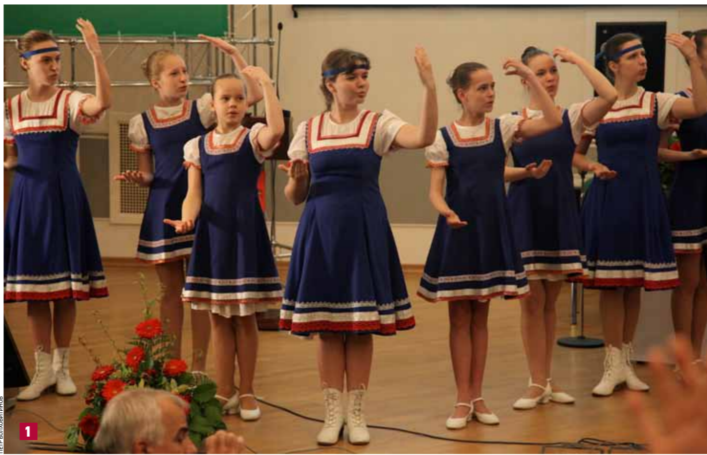
1 Выступают «Ангелы надежды» 2 Безбарьерной среде — быть!

Вопросы качества всех наших работ, всех видов социальных услуг, которые мы оказываем и будем оказывать населению приобретают сегодня первостепенное значение. Мы идем по пути универсального дизайна, мы хотим выйти полноправным и достойным участником про-