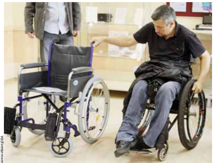
Коляска должна быть для них «как родная»

И потому, что остаются претензии к качеству этих изделий, и потому, что меняются потребности потребителей. И одной из главных проблем на сегодняшний день становится проблема индивидуального подбора технических средств реабилитации, в частности и в первую очередь — инвалидных кресел-колясок для детей и взрослых, специальных тренажеров, протезно-ортопедических изделий. По сути, можно сказать так: в деле создания технических средств реабилитации наступает новый этап, от «поточно-производства» необходимо переходить к принципам, по которым работают (или работали когда-то) наши ателье. Понятная аналогия, не правда ли? Не покупать платье или пальто в магазине, а заказывать и шить точно по фигуре клиента, учитывая все особенности и нюансы заказчика, все его пожелания и требования. И это более чем важно, это — жизненно необходимо людям с инвалидностью. Платить-то купил неудачно в магазине — бог с ним, в конце концов. А вот если досталась тебе неудачная, неудобная, неподходящая коляска, с которой ты не растаешься никогда?