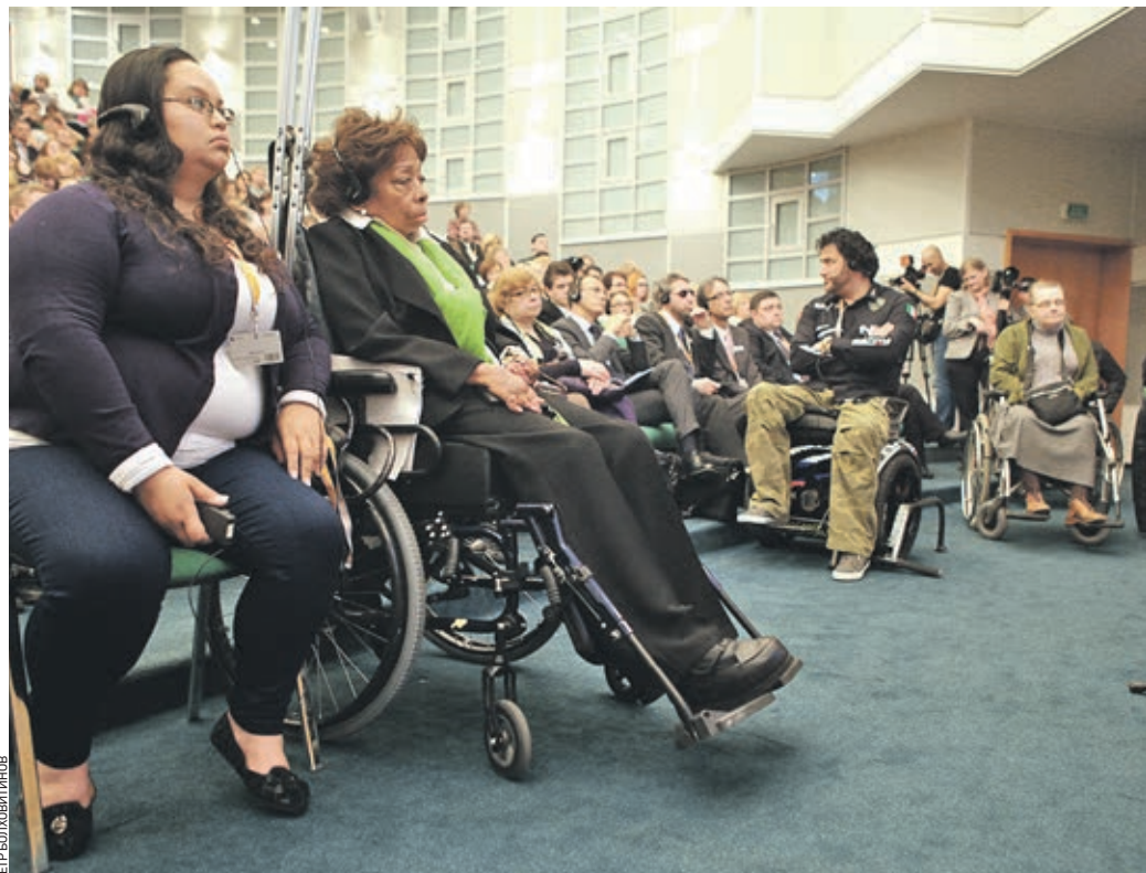
Каждый участник конференции участвует в решении проблем людей с инвалидностью

Сегодня во всем мире перед всеми цивилизованными государствами стоит приоритетная задача: обеспечить гражданам, в том числе и с различным видом инвалидностью, равные права и равные возможности для успешной жизни, самореализации, работы, творчества. «Государство не может считаться цивилизованным, если в нем не обеспечены равные права граждан, способных участвовать в жизни общества, — говорится в приветствии участникам Пятой Международной конференции «Равные права — равные возможности» заместителя председателя правительства РФ Ольги Голодец. — Хочу выразить уверенность, что конференция станет площадкой для обмена практическими знаниями и опытом, в том числе международного сообщества, в решении проблем обеспечения равных возможностей инвалидов и позволит определить перспективы направления работы в данной сфере». Напутственные слова собравшимся также передал министр труда и социальной защиты РФ Максим Топилин: