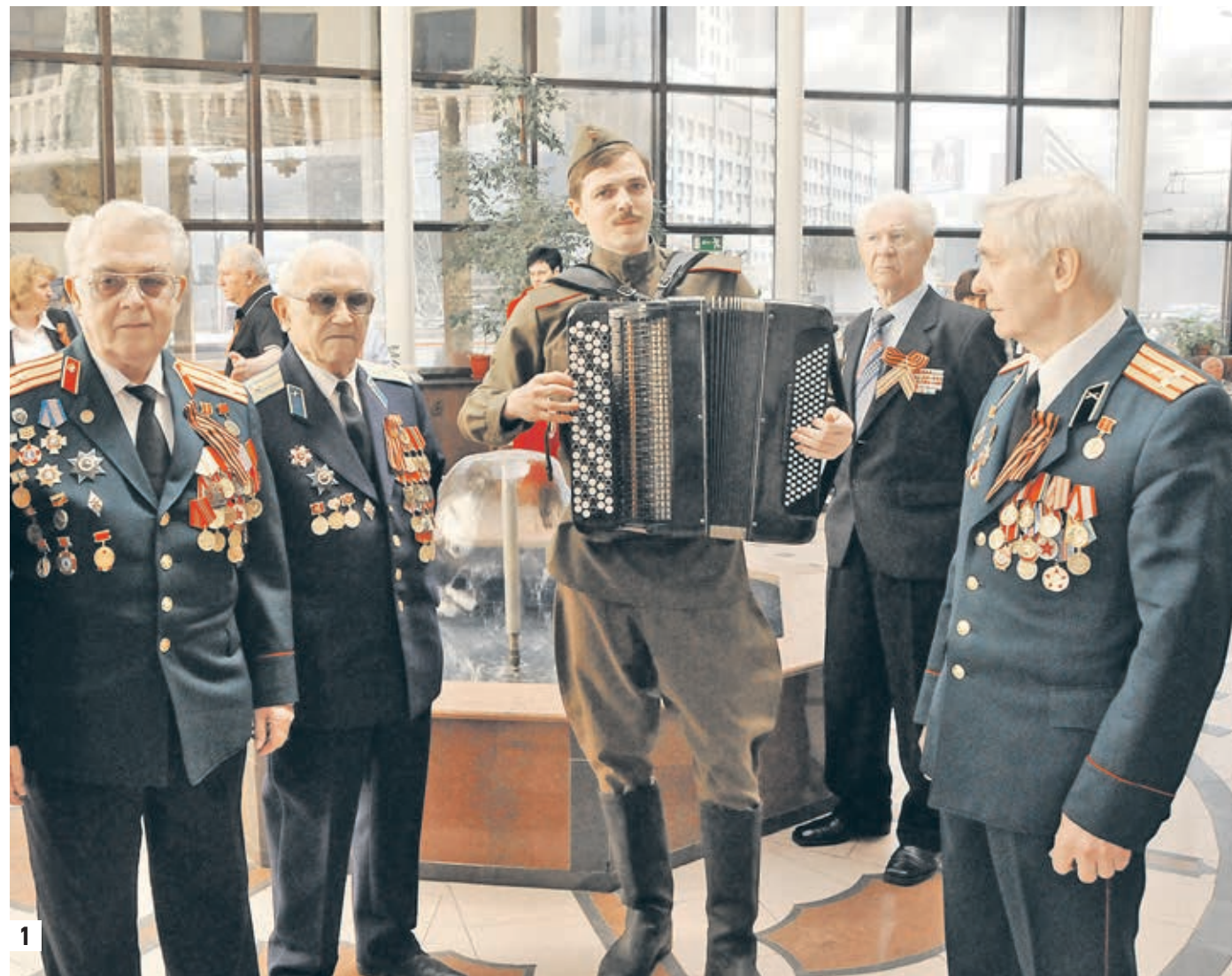
1 Это факт: когда звучат солдатские песни, молодость возвращается! 2 Фронтовикам всегда есть о чем поговорить 3 Этот дом на Олимпийском проспекте — место притяжения для многих