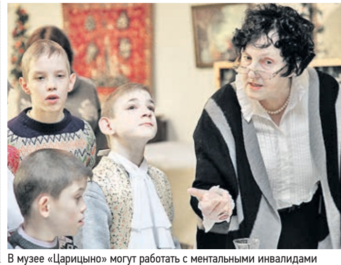
В музее «Царицыно» могут работать с ментальными инвалидами