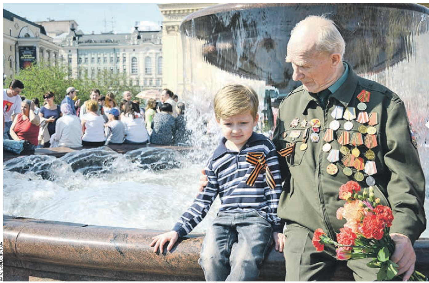
«Спасибо деду за Победу!» Правнук поймет глубинную суть событий потом. А пока — музыка, цветы, май, салют! И прадед рядом...