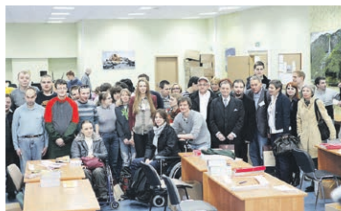
Во время встречи в полиграфической мастерской