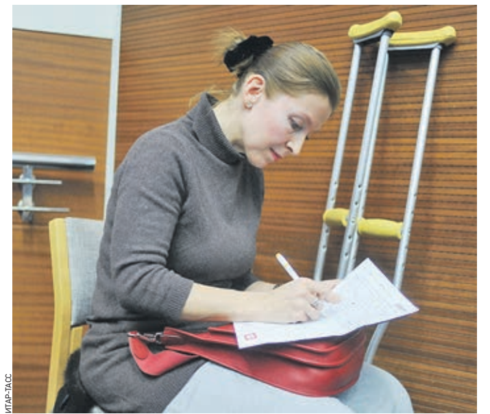
Новые технологии позволяют людям с инвалидностью достигать самореализации в личной жизни, учебе, работе, творчестве