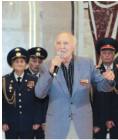
В.И. Балашов и хор Московского Дома ветеранов

Стихи о войне читал участник Курской битвы, легендарный диктор Центрального телевидения Виктор Иванович Балашов.