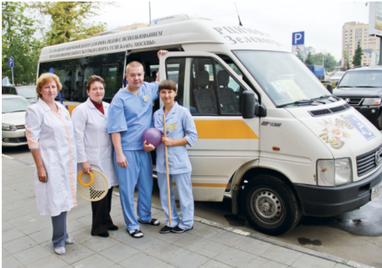
Мобильная бригада для оказания реабилитационных услуг на дому