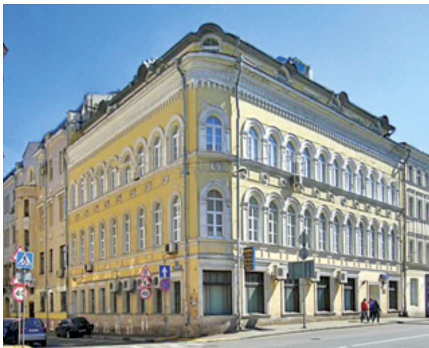
Сретенка, дом 6 построил архитектор Шервуд в 1920-е годы

Правда, ни Сретенский монастырь, ни собственно Сретенка не