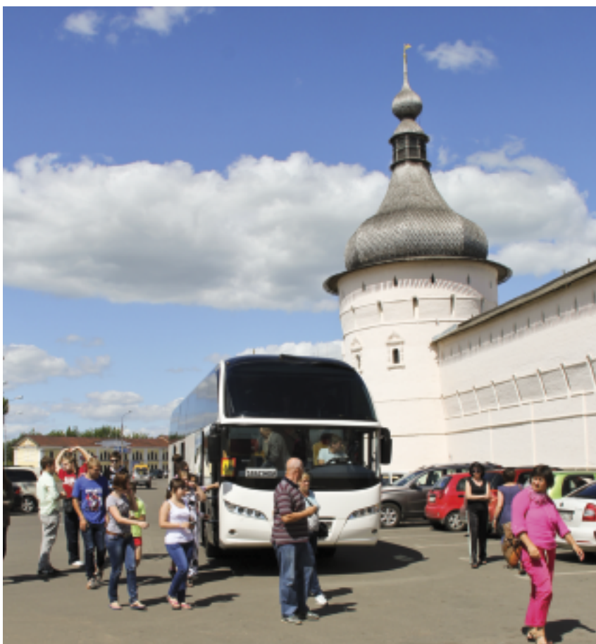
У древних стен Ростовского кремля

ГБУ ТЦСО «Царицынский» совместно с управой района «Царицыно», при участии городской библиотеки №154, организует экскурсии, ориентированные на патриотическое воспитание молодежи, на укрепление связи между старшим и младшим поколениями москвичей. В экскурсионных поездках принимают участие подопечные ТЦСО «Царицынский» – ветераны Великой Отечественной войны, труженики тыла, школьники, учащиеся колледжей.