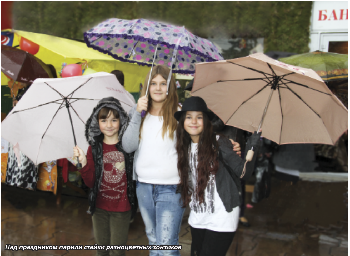
Над праздником парили стайки разноцветных зонтиков