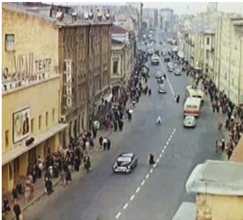
Сретенка, кинотеатр «Уран». 1950-е годы

На древнюю православную улицу агрессивно наступают новоделы, и старины здесь год от года становятся меньше и меньше. Какие-то здания сносятся, и на их месте появляются строения постмодерна с телекамерами на фасадах. Или вообще остаются пустыри, в воздухе над которыми, кажется, витает незримая связь с прошлым, не желая раствориться в небытие.