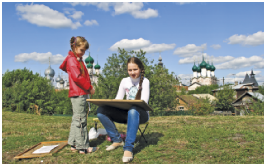
Воспитанница изостудии «Семицветик»

В колокола звонили по-разному. Например, «Ионинский» звон, названный так в честь самого известного ростовского митрополита Ионы Сысоевича, отличался большой торжественностью. Его исполняли пятеро звонарей: двое раскачивали полуторатонный язык «Сысоя», третий звонил в «Полиелейный», четвертый бил в пять средних колоколов, а пятый – в остальные четыре маленьких колокола. А под «Калязинский» звон плясали. Мелодичные