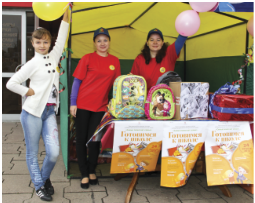
Первоклашек ждут подарки