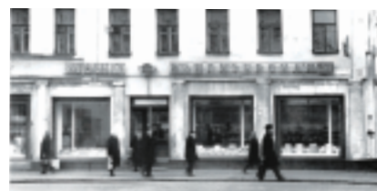
Сретенка, дом 18. Филипповская булочная. Фото 1967 года