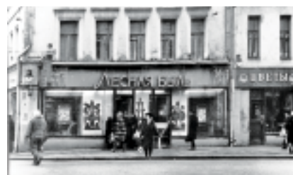
Сретенка, магазин «Лесная бель»