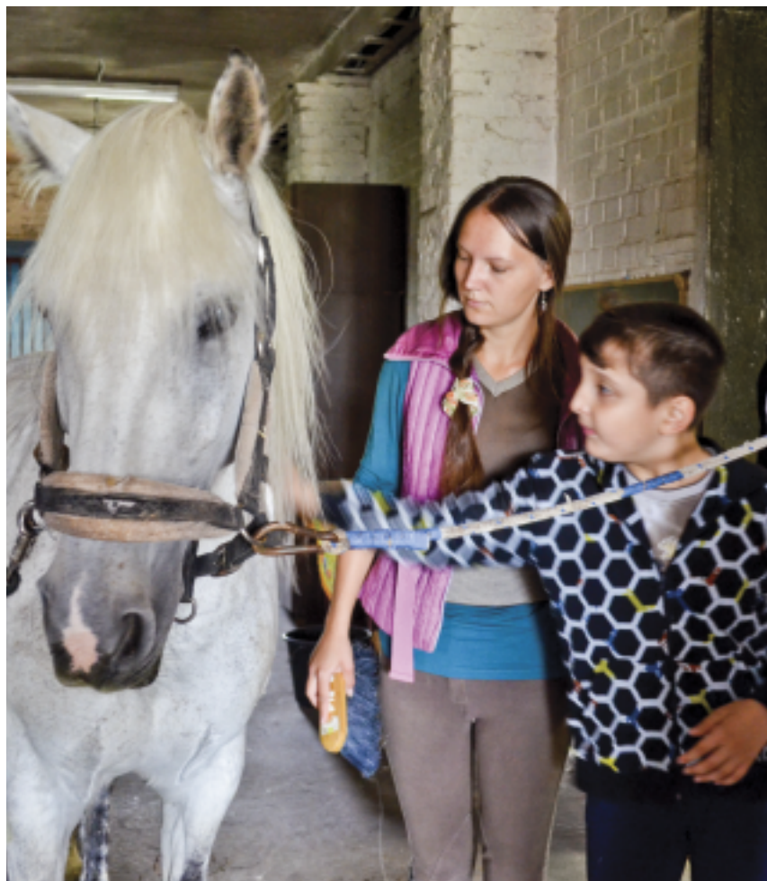
Гурген готовит лошадь перед занятием

Центр профессионально-творческой реабилитации «Преодоление-Л»