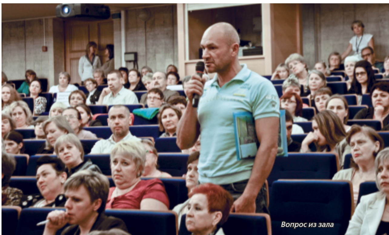
Вопрос из зала