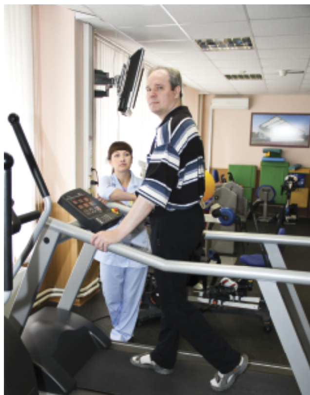
Занятие с клиентом в постинсультный период, тренировка ходьбы на «бегущей дорожке»

Для наиболее подготовленных предлагается адаптивный спорт, используемый в основном для активной реабилитации молодых инвалидов. Людям с нарушениями функции опорно-двигательного аппарата показан настольный теннис, для слабослышащих детей-инвалидов и молодых инвалидов – волейбол, бадминтон, теннис.