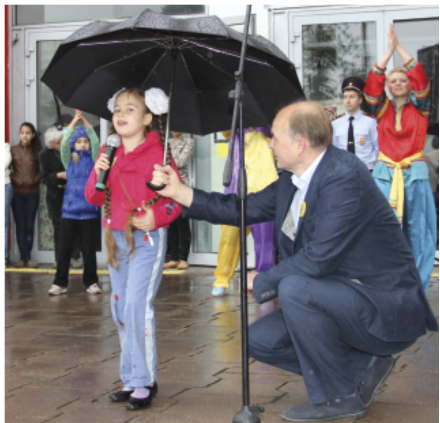
Песенка дождя катится ручьем

Меня покорило детское жизнелюбие, и я невольно остановился рядом с девочкой и ее мамой. Бу-