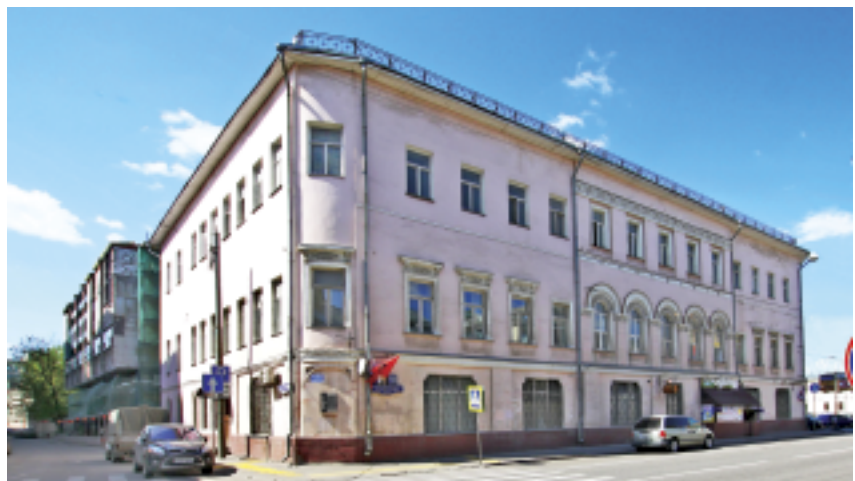
Сретенка, 11 – дом купца Н.И. Сушенкова – П.Ф. Сазикова, построенный в начале XIX века

Помнится, тридцать лет назад здесь был знаменитый магазин обуви от фабрики «Заря». А какой был магазин «Лесная бэль» в доме 16 на углу с Луковым переулком, где продавали перепелов и рябчиков, медвежатину и лосятину! Сейчас здесь «Шоколадница». В доме №18 работала знаменитая Филипповская булочная. В левом окне здания, как говорили люди старшего поколения, в конце 1940-х годов стоял автомат, на котором штамповали вафельные стаканчики для мороженого. Сейчас той булочной нет.