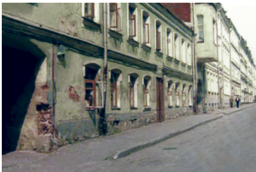
Сретенка, Колокольников переулок

В XVII веке здесь находилось несколько больших слобод – Пушкарская, Печатная, Панкратьевская и Стрелецкая. Район Сретенки, застроенный лавками торговцев и мастерскими ремесленников, называли Панкратьевской черной слободой. В центре Сретенки и в примыкавших к ней переулках располагалась обширная Пушкарская слобода, населенная пушкарями. Между дворами Панкратьевской черной слободы были поставлены дворы стрельцов.