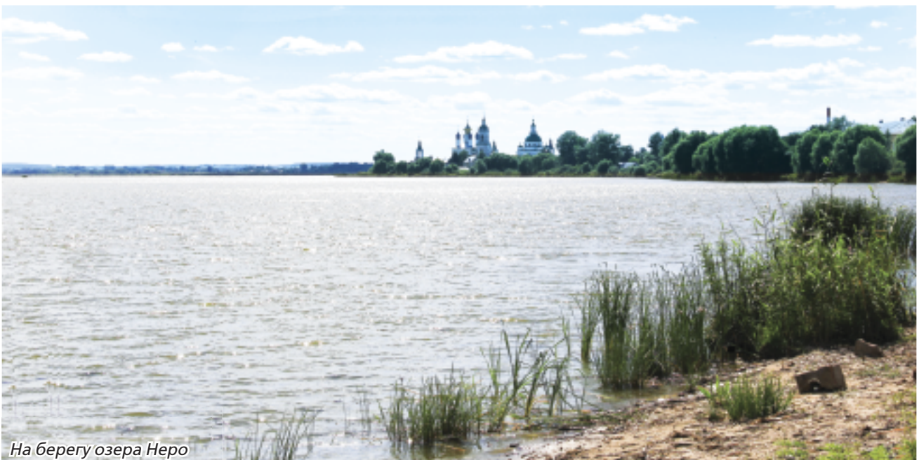
На берегу озера Неро

– Тысячу лет назад русские князья и миссионеры из Византии насильно загоняли в воды озера Неро прежних язычников – обитателей здешних мест и крестили их, – напевно говорил былинный старик, уроженец Ростова Великого. – В годы Великой Отечественной, когда действовал запрет на вырубку леса, некоторые мужики умудрялись выкорчевывать из илистого дна Неро огромные пни многовековых деревьев. Выходит, там, где сейчас водная гладь, когда-то шумели дубравы? Старики рас-