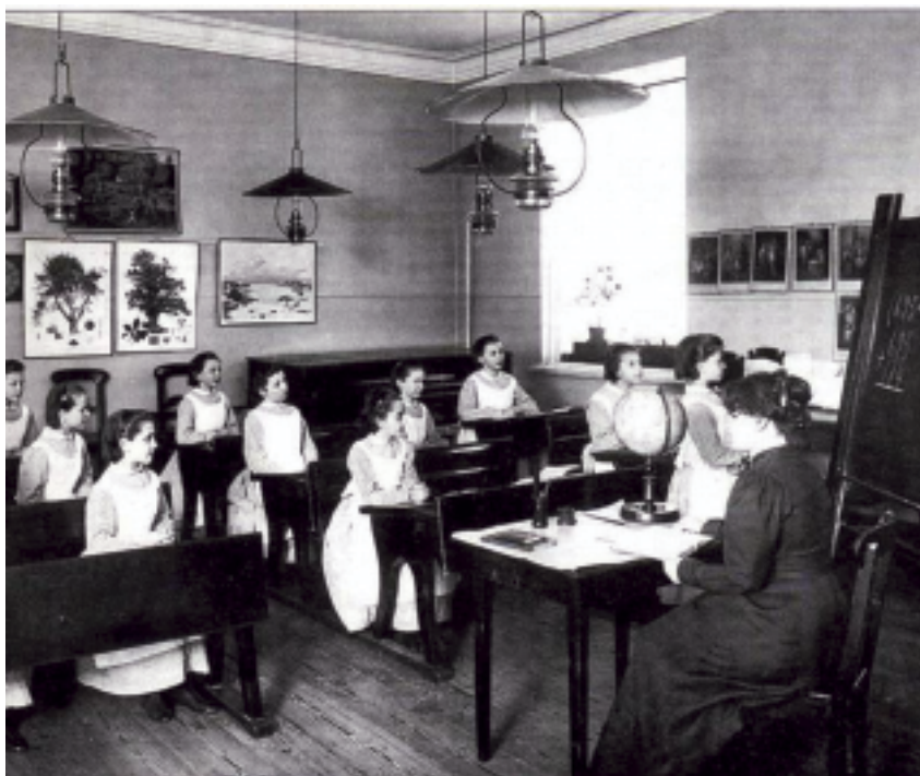
Сиротский институт императора Николая I. На уроке арифметики

У нас 81 программа, по которым можно получить повышение квалификации, и 8 программ перепод-