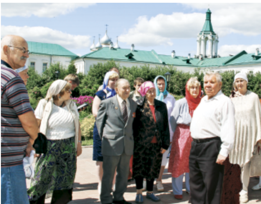
В Спасо-Яковлевском Димитриевом мужском монастыре

Этот ансамбль в целом по замыслу митрополита Ионы Сысоевича должен был символизировать небесный град – горний Иерусалим. Все храмы на территории Ростовского кремля