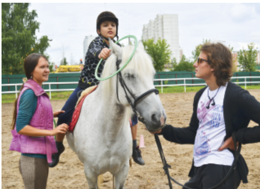
Иппоцентр в поселке Восточный

Температура тела лошади на полтора градуса выше, чем у человека, и потому мышцы спины животного в движении разогревают мускулатуру всадника.