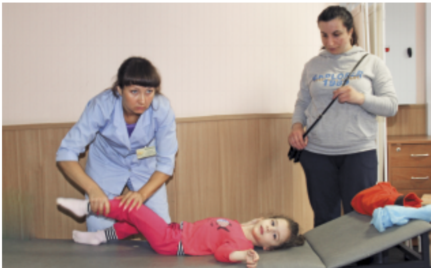
Индивидуальное занятие лечебной физкультурой для ребенка с ДЦП

Центра, а сами едем к нему и индивидуально, адресно занимаемся реабилитацией. Одна мобильная бригада может обслуживать до четырех клиентов в месяц. К сожалению, статистические данные говорят об увеличении количества инвалидов I группы, то есть с тяжелой степенью утраты функций, поэтому востребованность мобильных бригад, скорее всего, будет еще большей.