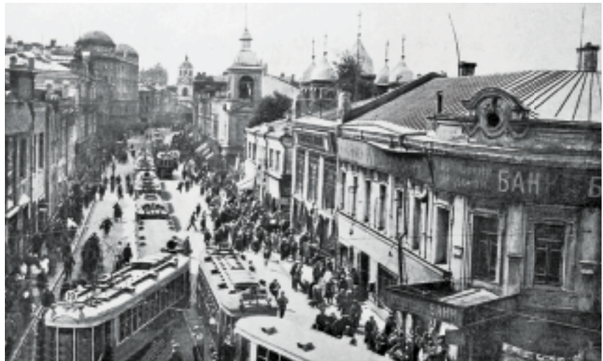
Сретенка, 1920-е годы

На улице «третьего сословия» не было таких богатых магазинов, как, например, на Петровке, Тверской или на Кузнецком Мосту. Зато на Сретенке всегда было изобилие всяких торговых лавок – мясных, рыбных, зеленных, множество мелких магазинчиков, трактиров, чайных, парикмахерских, дешевых мебелиро-