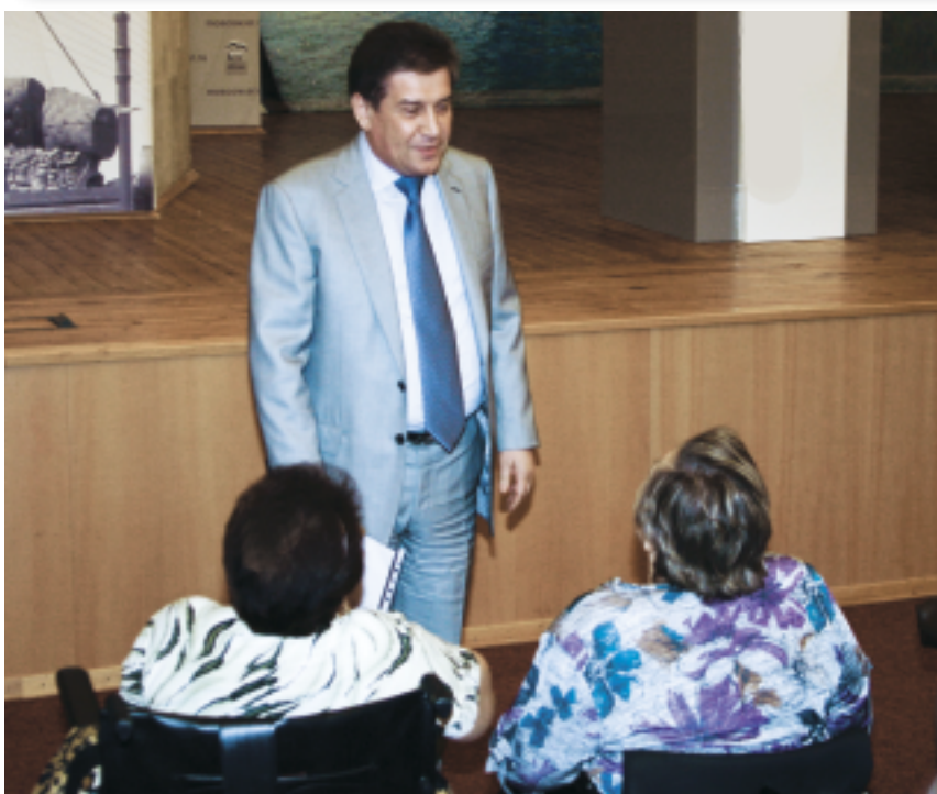
Ни одна просьба не останется без внимания