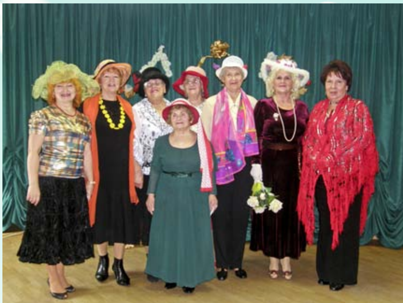
Театральное ателье мод «Всё дело в шляпе», ТЦСО «Царицынский»

то Отдел опеки и попечительства принимает решение о признании его нуждающимся в помощи государства. Двое ребят из СРЦ для несовершеннолетних ЮАО были направлены в Центр содействия семейному воспитанию, где им