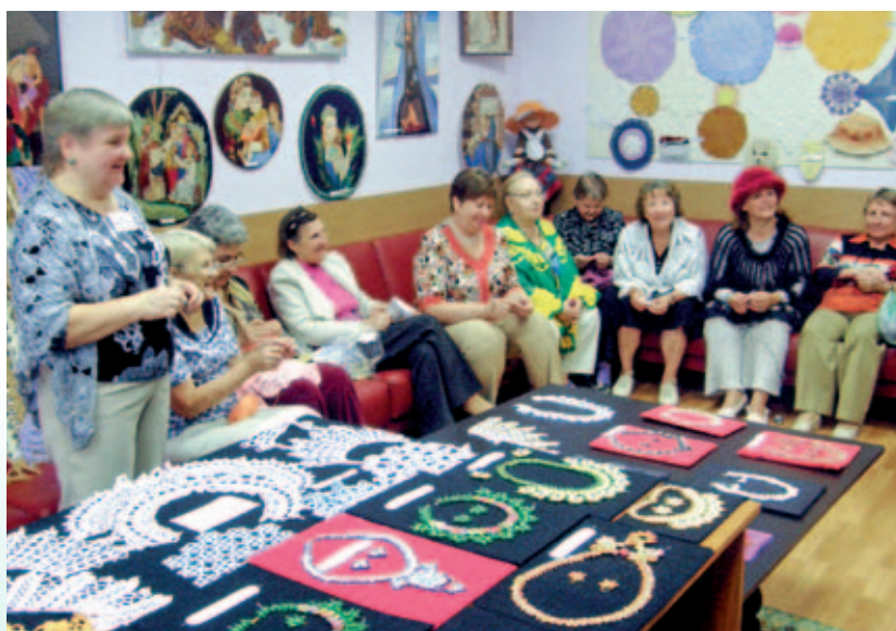
Выставка работ подопечных отделения дневного пребывания

делений реабилитации и дневного пребывания. Ездить в кинотеатры нашим пенсионерам неудобно, да и не по карману. А мы восполняем этот пробел, показывая интересные, познавательные фильмы – про подводный мир, космос, путешествия по городам и весям. Зрителей старшего возраста впечатляет 3D-технология, создающая эффект присутствия. В наших центрах регулярно проходят занятия университета третьего возраста, мастер-классы, занятия кружков и клубов по