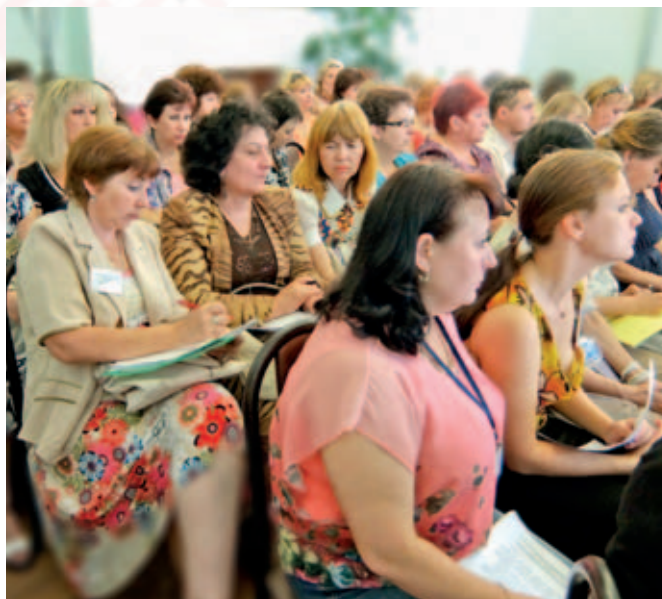
Коллеги перенимают опыт

Исцеляющих эффектов можно достичь посредством игротера-