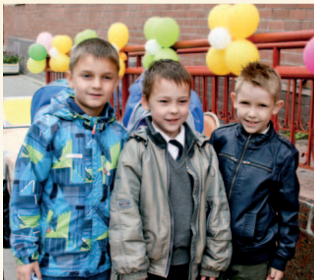
Готовы к путешествию в Страну знаний