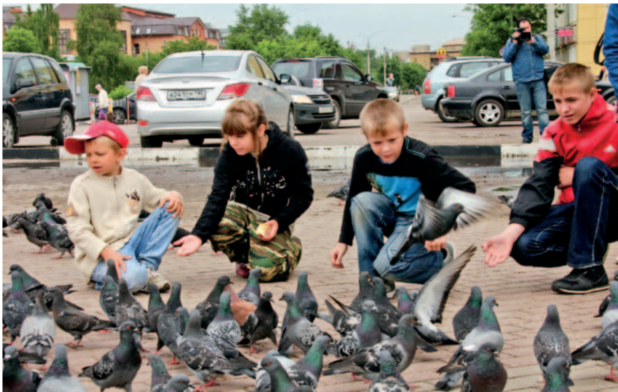
Дети должны расти добрыми