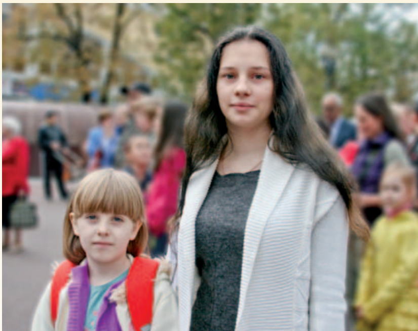
С новым ранцем – в новый учебный год