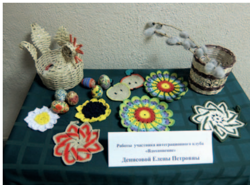
Работы участников интеграционного клуба «Вдохновение»