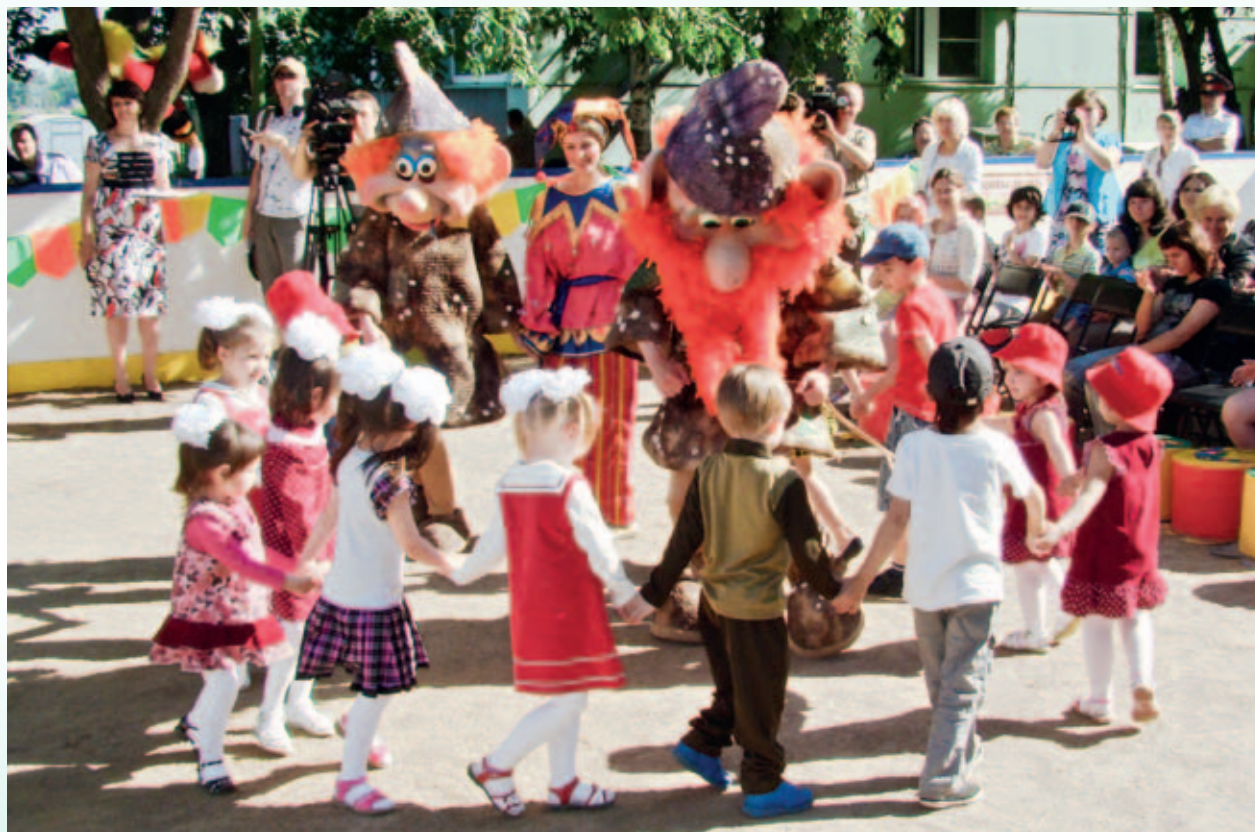
Детский праздник в Социально-реабилитационном центре для несовершеннолетних ЮАО