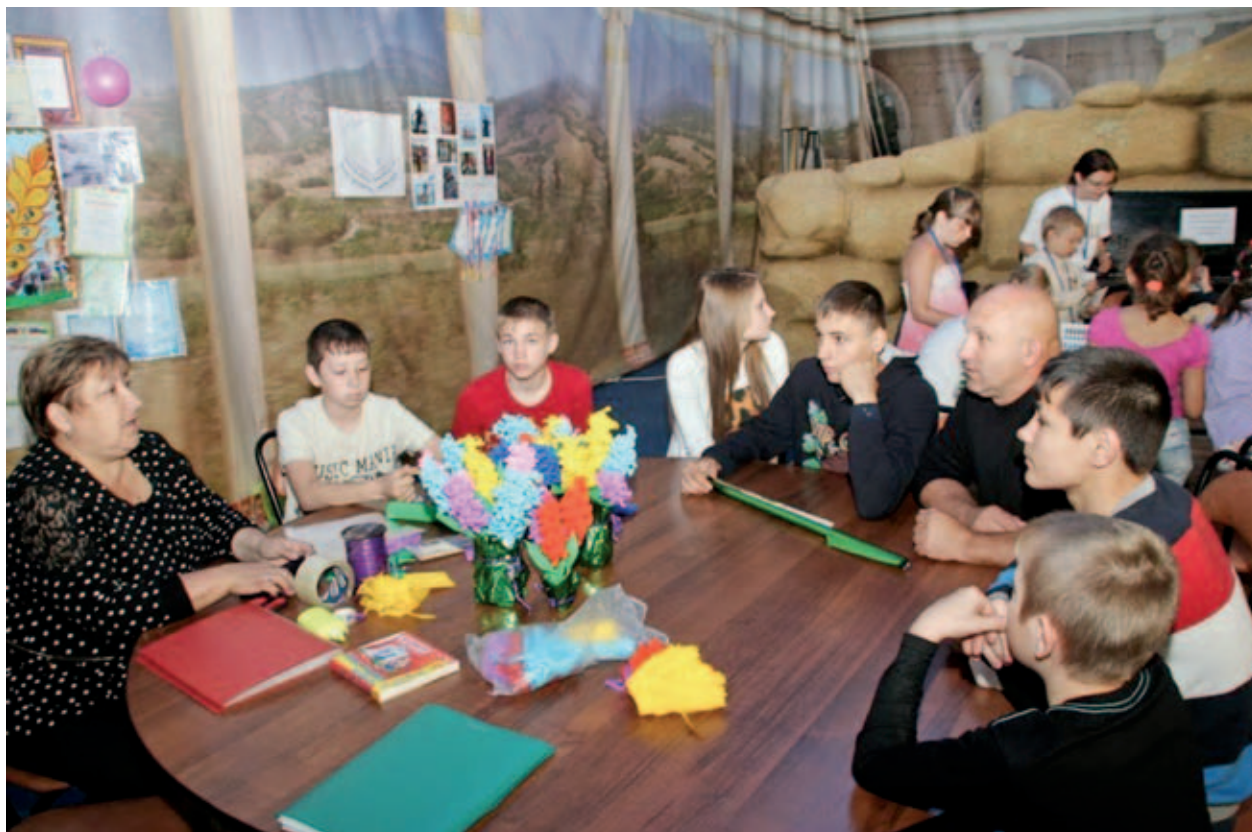
На конкурсе «Наш теплый дом»