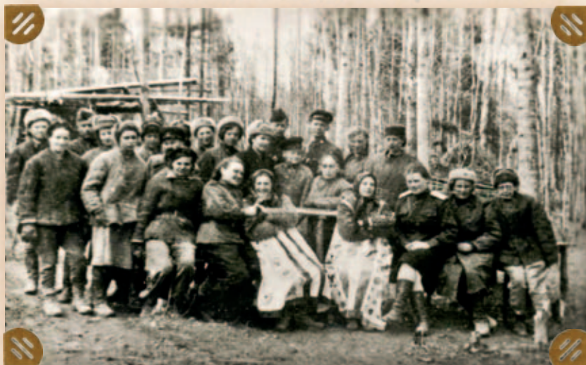
Собрание коллектива 1-го Хирургического отделения СЭГ №290. 4 мая 1943 года

В день начала войны Министерству путей сообщения было дано поручение переоборудовать часть