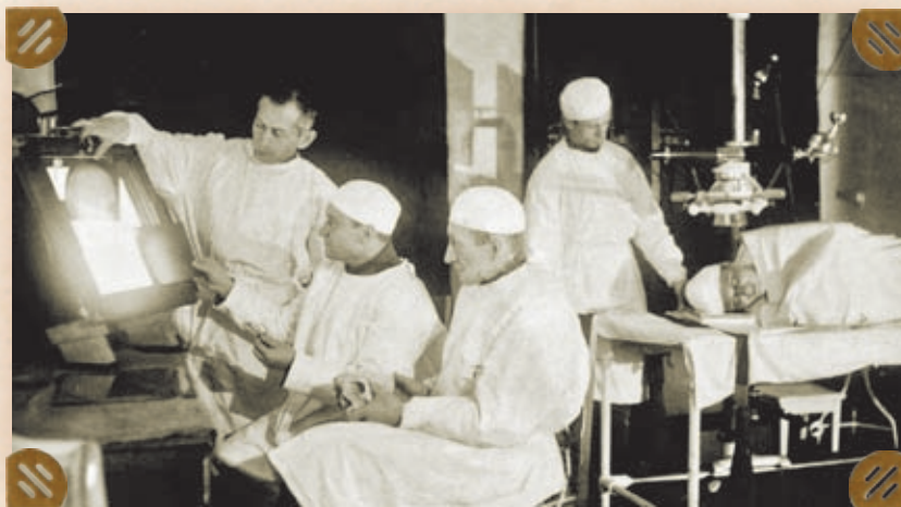
Рентгенологическое отделение СЭГ №290

После освобождения Минска 3 июля 1944 года СЭГ вместе с