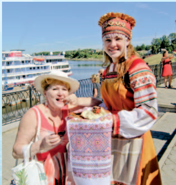
Хлебом-солью встречали супербабушек в Мышкине

–Я вообще путешественник со стажем. Всё, что зарабатывала, тратила на путешествия. По маршруту Москва-Волга прошла уже в третий раз. На теплоходе добиралась из Кипра до Израиля. Одно из самых красивых моих путешествий было на пароме из Питера в Хельсинки и Стокгольм. Я очень люблю Скандинавию и полную противоположность – Андалузию. Казалось бы, два эмоциональных полюса, но мне очень комфортно и в Испании, и в странах Скандинавии.