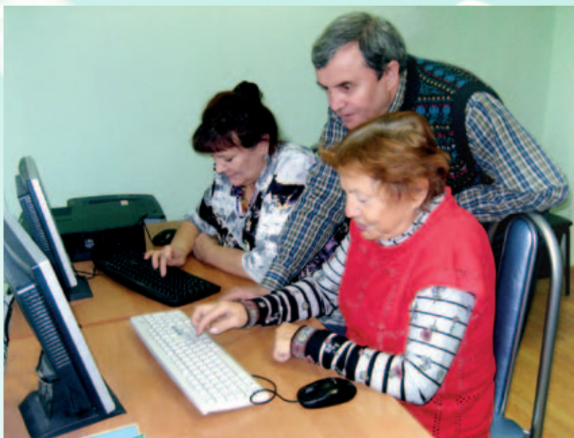
Освоение компьютерной грамоты

90-летие. Когда мы проводили специальное исследование, выяснился интересный факт. Оказывается, люди, охваченные домашним обслуживанием с 1990-х годов, до сих пор живы-здоровы и чувствуют себя прилично. А про их ровесников, которые встали на учет относительно недавно, этого не скажешь. Следовательно наш уход и забота реально продлевают жизнь подопечным. Нас это очень радует!