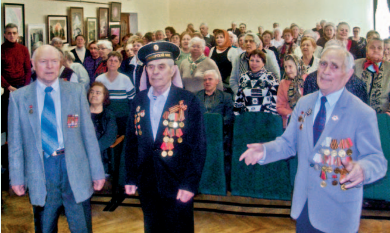
Поздравление ветеранов с 9 Мая

Оздоровительная программа «Око возрождения» получила звание лауреата в номинации «За новизну и инновации в реализации программ для москвичей старшего поколения». Это одно из убедительных подтверждений тому, что мы создаем необходимые условия для развития разносторонних интересов старшего поколения, энергии которого можно просто позавидовать.