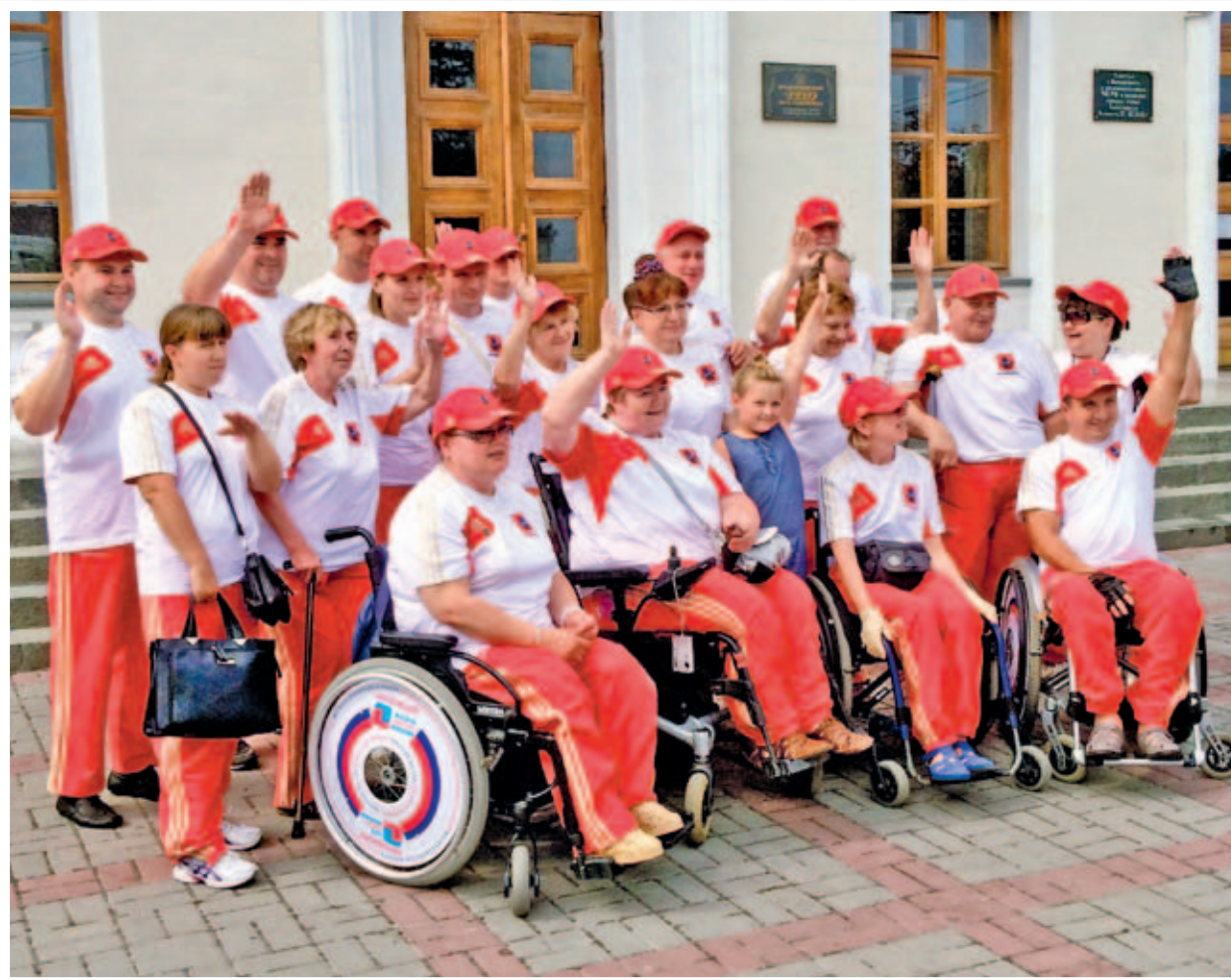
Участники автопробега «Крым, доступный для всех» на площади Ушакова в Севастополе