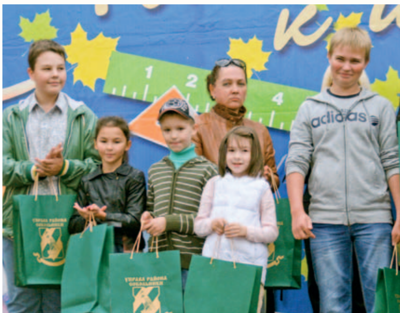
Приятных сюрпризов от благотворителей было немало

Акция «Семья помогает семье» впервые была проведена в 2006 году по инициативе Русской Православной Церкви и была под-