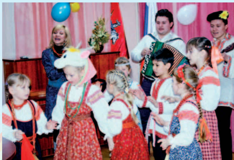
Масленица в Центре «Родник»

– Мы делаем всё возможное, чтобы ребенка не изъяли из семьи, ведем профилактическую работу. Для этого недавно был создан отдел Службы по ин-