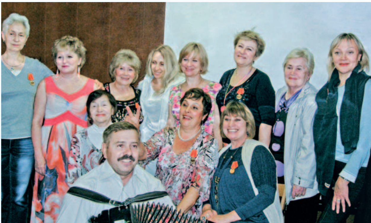
Все супербабушки – большие поклонницы хорового пения под аккомпанемент баяна

У нее свои взаимоотношения с понятием «движение» и определением «пути-дороги». Работала она вагоновожатой, потом почти двадцать лет – таксисткой. Если говорить о способе преодоления расстояний, то ей даже с парашютом доводилось прыгать.