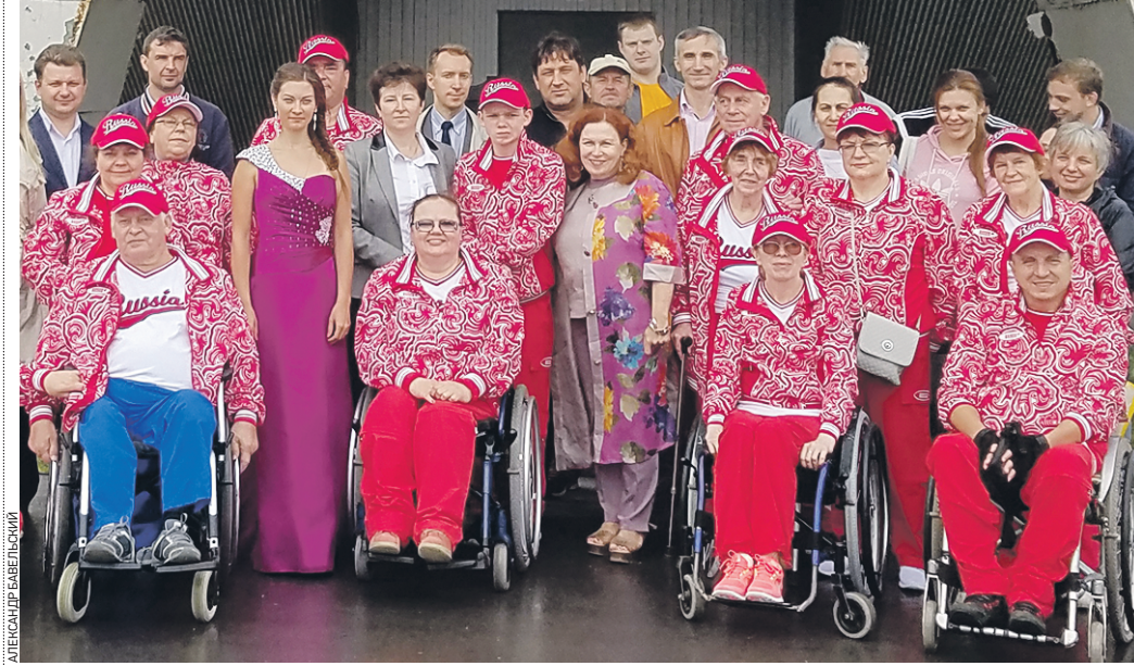
4 июля 10:05 Территория бывшего завода АЗЛК. Команда водителей с ограничениями по здоровью и их помощники за 10 минут до старта автопробега «Города Поволжья»

В рамках акции мы встречаемся с руководителями автопредприятий, которые располагаются в Поволжье. Эта акция — своеобразная пропаганда доступного туризма, а также способ привлечь внимание отечественного автопрома к вопросу производства авто с ручным управлением.