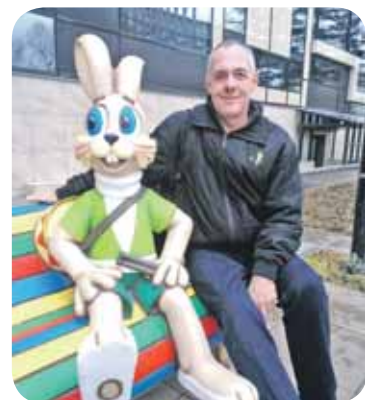
Беседу вел Вениамин ПРОТАСОВ

Становитесь участником проекта «Московское долголетие»! Запишитесь там, где хочется заниматься! Подробная информация о проекте на сайте mos.ru/age . Телефон горячей линии +7(495)-221-02-82 (с 8.00 до 20.00).