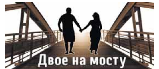
Двое на мосту

Кроме того, подобное упражнение с мини-рассказиком позволяет еще раз пережить положительные эмоции, вызванные описанным опытом, и получить дополнительную дозу гормонов счастья.