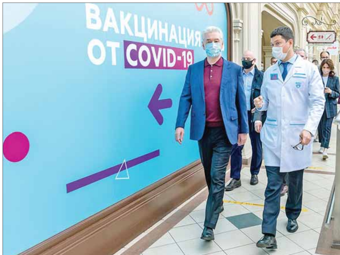
Сергей Собянин осмотрел центр вакцинации, который был вновь открыт в ГУМе, и пункт экспресс-тестирования на антиген возбудителя новой коронавирусной инфекции. Центр вакцинации в ГУМе открыт ежедневно с 10:00 до 21:00

Центры госуслуг достигли высокого уровня культуры искреннего сервиса и сейчас совместно с городским Департаментом здравоохранения формируют дружелюбную атмосферу в городских поликлиниках. Сотрудники центров госуслуг «Мои Документы» стали неотъемлемой частью нового московского стандарта — ежедневно они помогают посетителям городских поликлиник более 11 тысяч раз, а всего с момента начала работы помогли уже свыше 1,2 миллиона раз.