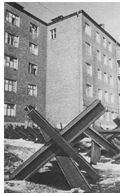
...во время войны (1942 г.)

посылал всё новые и новые отряды стойких бойцов-москвичей на линию огня. Враг делал ставку на то, чтобы массированными воздушными атаками дезорганизовать жизнь города, разрушить промышленность, подорвать силу духа населения. И то, что эти планы потерпели крах, что ритм промышленности Москвы, работающей на оборону, не был нарушен бомбардировками, является результатом большой работы, проведённой Московской партийной организацией. Ещё весной 1941 года для того, чтобы максимально обезопасить население, в столице развернулось строительство бомбоубежищ и проводились другие мероприятия ПВО. Заботились и о том, чтобы в случае опасности уберечь материальные ценности, дома, промышленные объекты. Активно участвовало в противовоздушной обороне и население города. Всё это помогло в кратчайший срок превратить Москву в единый боевой лагерь. Население быстро откликнулось на все мероприятия и активно участвовало в работах по укреплению противовоздушной обороны. После первых воздушных налётов оказалось, что не хватает воды для тушения пожаров, и было решено создать водоёмы. Опыта в этом деле не было, и в первое время из открытых котлованов вода уходила, просачиваясь через грунт. На