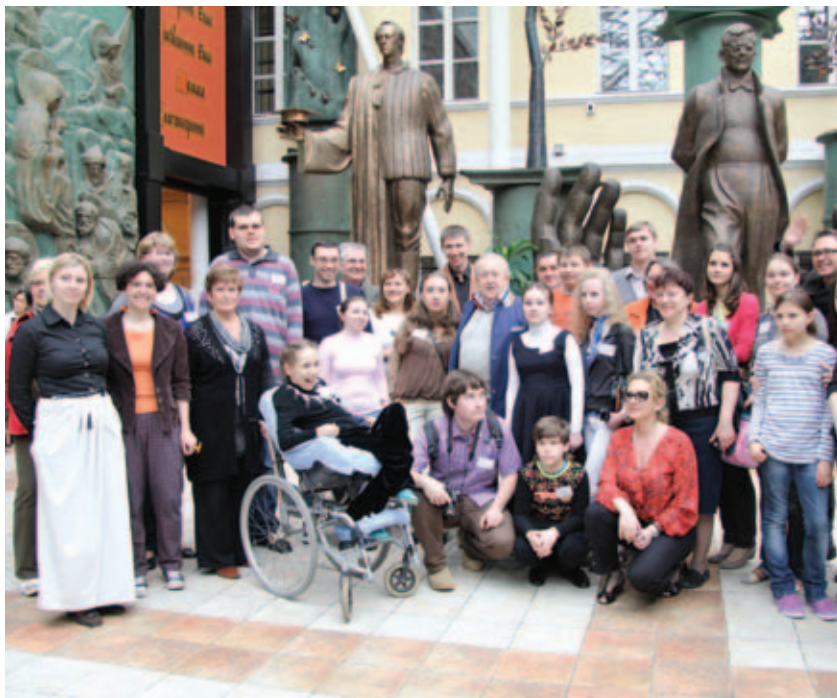
Гости и организаторы акции в «Яблоневом саду» Галереи искусств Зураба Церетели