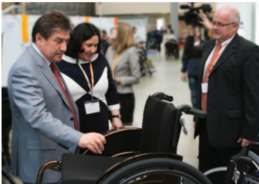
Министр Правительства Москвы, руководитель Департамента социальной защиты населения города Москвы Владимир Петросян на стенде своего Департамента

«В 2011 году показатель приспособленности составлял всего 52%, в 2012 году мы надеемся выйти на показатель 64%, – сказал Владимир Петросян. – К концу 2016 года задача, поставленная Мэром, будет полностью решена. Для этого в городе есть всё – и финансовые ресурсы, и подготовленные кадры». Глава Департамента также подчеркнул, что в решении вопроса по организации доступной среды для инвалидов необходимо контролировать не только