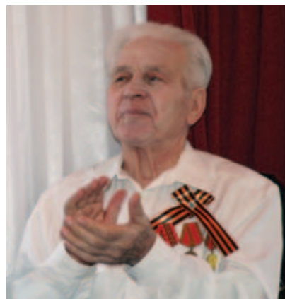
В празднике приняли участие около 100 ветеранов

Сотрудниками и жильцами ПВТ №31 был организован прекрасный концерт, составленный из легендарных песен военных лет, в котором приняли участие жители пансионата и профессиональные артисты. Но поскольку все подпевали друг другу, никакого разделения на профи и са-