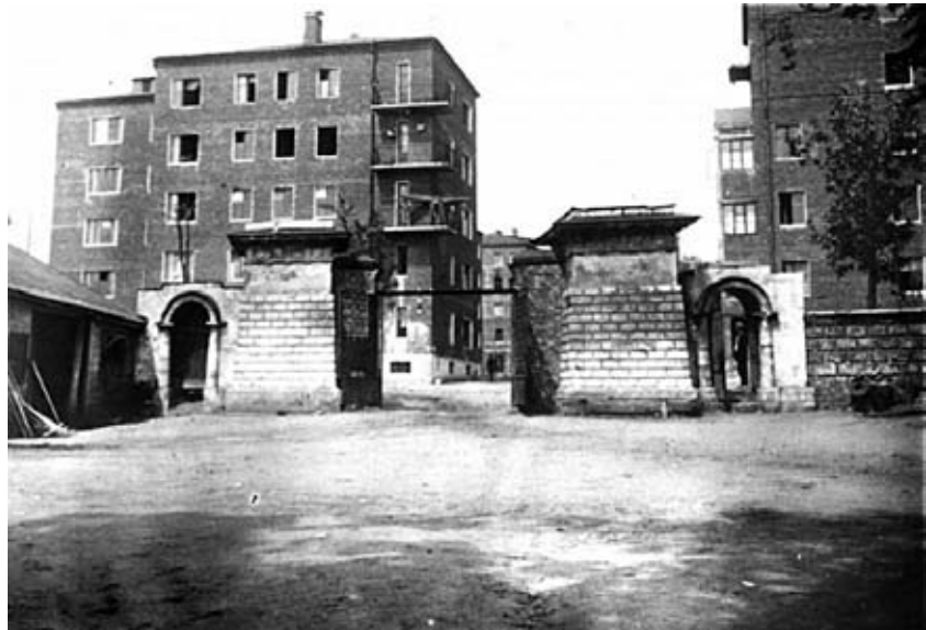
Мантулинская улица, на которой жили сёстры до войны (1930–1935 гг.)