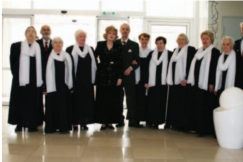
Ансамбль Пансионата для ветеранов труда №31 «Будь здоров!»

В устроенном празднестве приняли участие около 100 ветеранов, и никто из них не ушёл без маленького приятного подарка на память – фотографии и цветов. С праздником вас, дорогие наши ветераны!