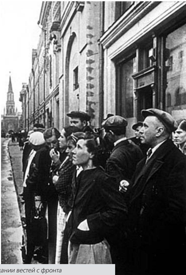
В ожидании вестей с фронта