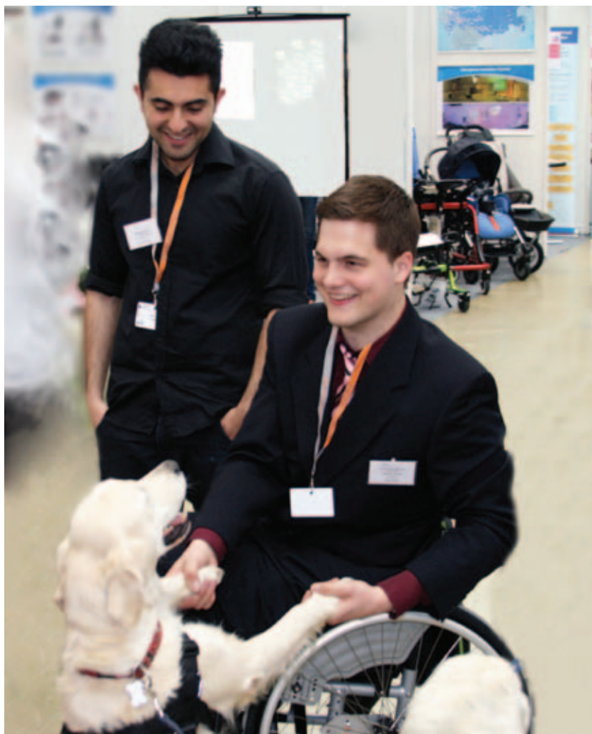
Интерес посетителей выставки вызвал стенд кинологоического центра

Одним из инновационных проектов в столице является создание службы интеграционных консультантов, которые позволяют молодым людям с ограниченными возможностями здоровья максимально эффективно адаптироваться в социуме. Сегодня более 200 тяжёлых инвалидов находятся под патронатом этой службы. Комплекс предоставляемых инвалидам реабилитационных услуг дополняется возможностью их оздоровления, санаторно-курортного лечения как в России, так и за рубежом (в Словении, Венгрии, Болгарии). Только в 2011 году на финансирование реабилитационных услуг негосударственного сектора было потра-