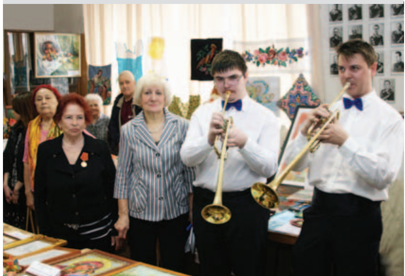
Открытие выставки увенчала торжественная фанфара