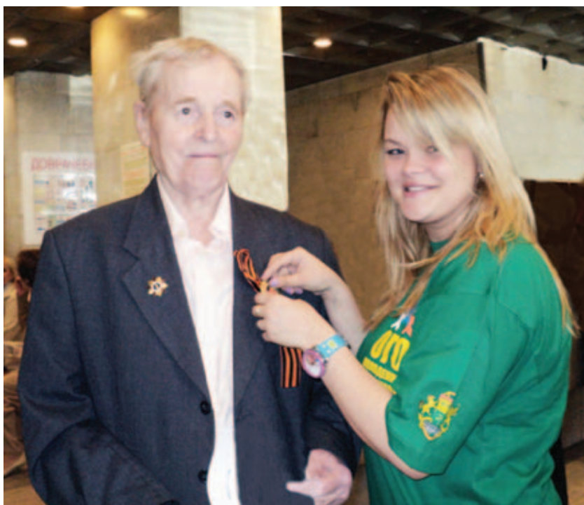
Волонтеры молодежной ассоциации ЮВАО раздавали ветеранам георгиевские ленточки

Давно отгремели набаты войны и распустились салюты Победы. Но до сих пор нет семьи, которую бы не коснулась война. Прадеды, деды и отцы, а также их жёны, дети и матери оказались в пекле огненных лет. Не все вернулись. Те же, кто выжил, с радостью и слезами встречают даты Великой Победы.