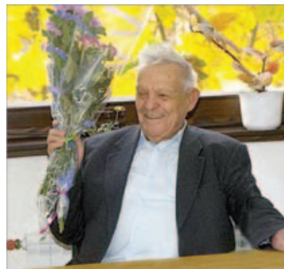
Академик РАН Сергей Михайлович Никольский

Для тружеников тыла сохранены натуральные льготы и значительно расширен объём социальной поддержки. Это и бесплатная путёвка в санаторий через органы социальной защиты населения, и возмещение расходов на проезд междугородным транспортом к месту лечения и об-