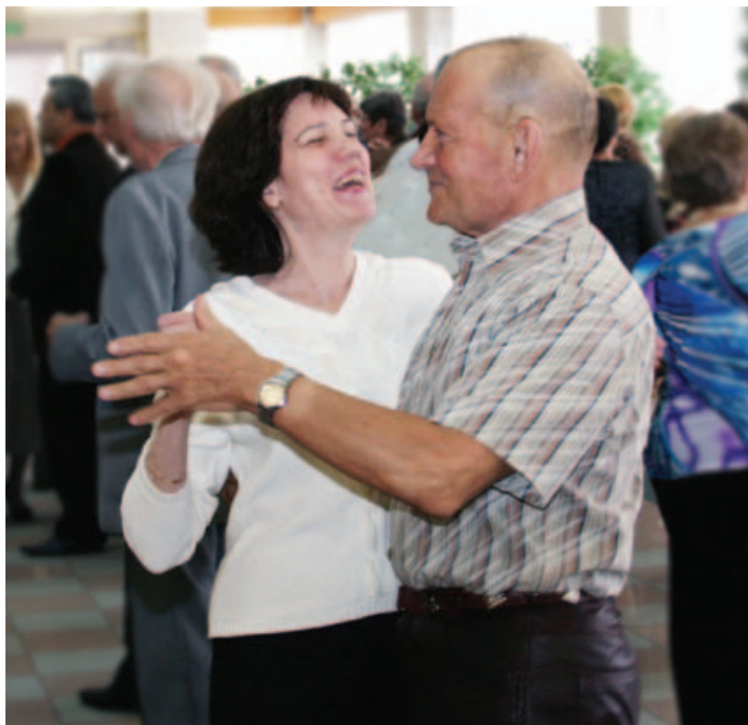
Гости с удовольствием танцевали твист и другие весёлые танцы их молодости

Екатерина Якель Марианна Вергунова Фото авторов